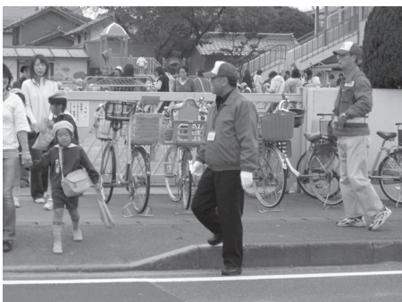
地域学校安全指導員による活動

平成 18 年度から「地域学校安全指導員」「登下校安全巡視員」を配置しました。19 年度には、見守りボランティア隊を結成、20 年度からは保護者のボランティア隊を募集するなどして、登下校時に通学路に立ち、幼児、児童生徒の安全確保のために様子を見守ります。