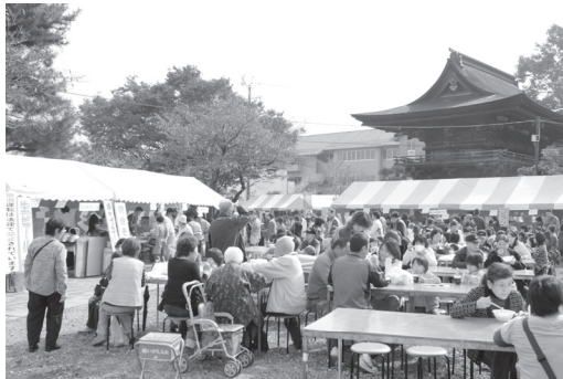
未来タウン北方ふれあいまつり

また、観光協会の運営に対する補助や、町内で開催されるお祭りなどのイベント行事（お十七夜、星まつり、かいこまつり）への支援をします。