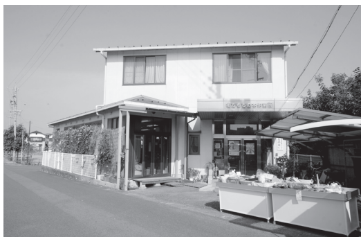
地域活動支援センター「もちの木」