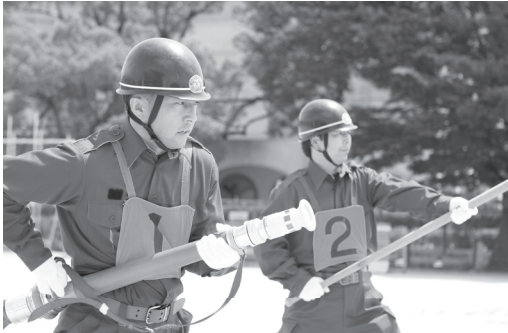
北方町消防団の消防演習

小型動力ポンプの購入など町内火災や自然災害に早期に対応できる組織づくりと活動を支援します。