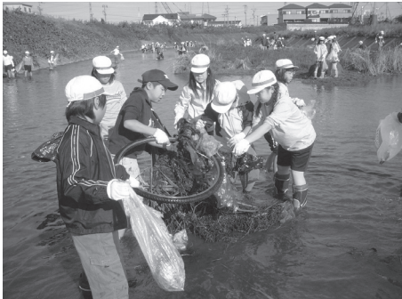
能力開花推進事業南小学校清掃活動

幼稚園、小学校、中学校では、地域の実態などに基づいて、それぞれに特色ある教育を行うため、幼稚園、小・中学校に必要経費（定額）を交付します。