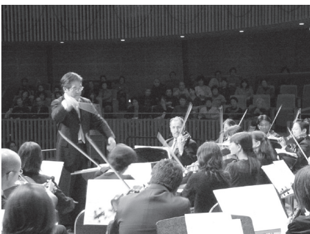
きらりホール クリスマスコンサート

また、鑑賞型事業とともに、住民手づくりのコンサートや発表会も積極的に支援します。