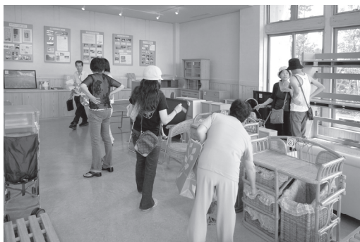
リサイクルセンター粗大ゴミ無償譲渡会

限られた地球資源を有効活用するため、種別ごとの分別収集、古紙類集団回収助成や電気式生ごみ処理機購入助成などを行い、ごみ資源化・再利用化を推進します。