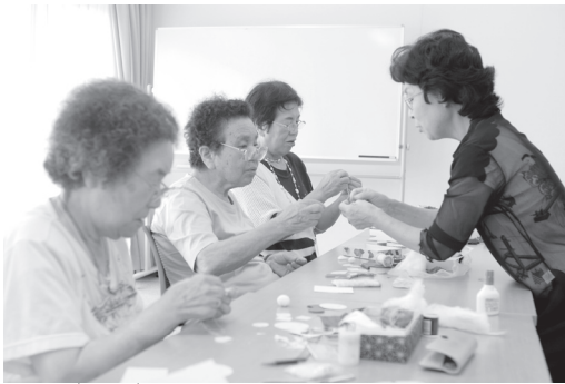
いきいきセミナー

要介護状態にならないようにするための事業や健康づくり、生きがいを推進していく事業を行っています。