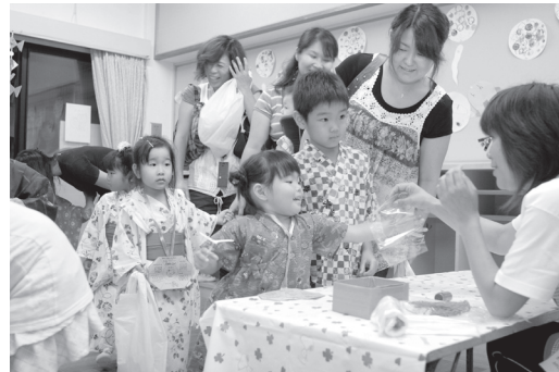
南保育園 夕涼み会