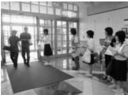
街頭啓発活動（アピタ）