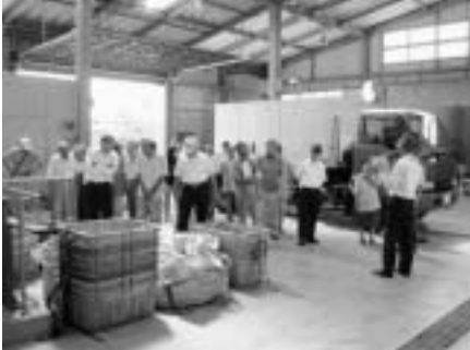
政策審議会（リサイクルセンター見学の様子）

住民参加によるまちづくりを進めるため、公募の委員による政策審議会や住民向けの予算書を作成し、説明会(町民対話集会)を開催します。