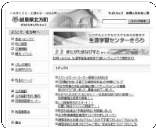
北方町ホームページ http://www.town.kitagata.gifu.jp/

町政の内容や、様々な情報を発信するため月 1 回の広報の発行やホームページの更新を行います。