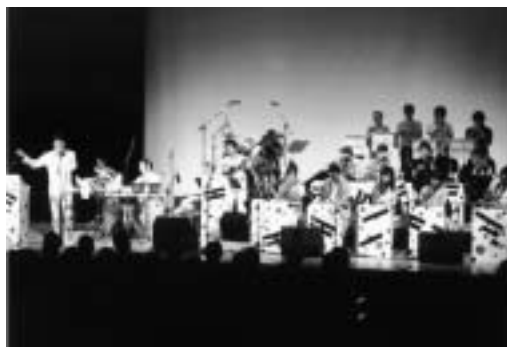
きらりホール イベント