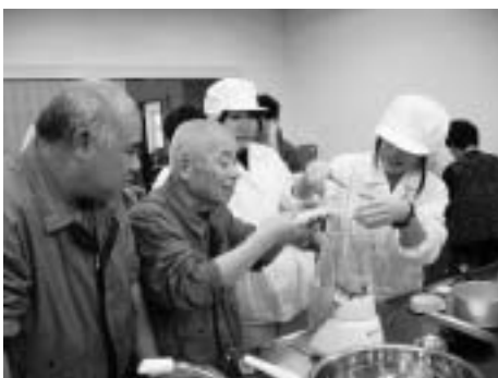
地域活動支援センター「もちの木」 農林高校交流会