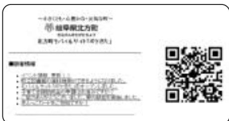
携帯電話用北方町ホームページ http://www.town.kitagata.gifu.jp/m/