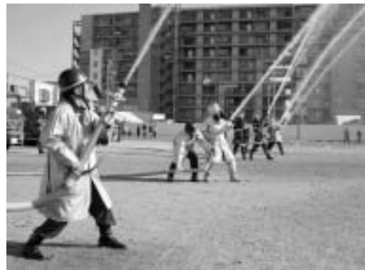
北方町消防団の出初め式