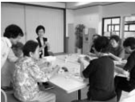
いきいきセミナー

要介護状態にならないようにするための事業や健康づくり、生きがいづくりを推進していく事業を行っています。