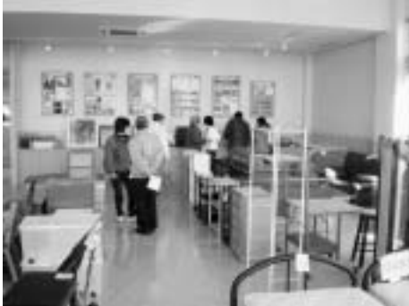
リサイクルセンター 粗大ゴミ無償譲渡会

限られた地球資源を有効活用するため、種別ごとの分別収集、古紙類集団回収助成や電気式生ごみ処理機購入助成、ごみ減量世帯への報償品交付などを行い、ごみ資源化・再利用化を推進します。