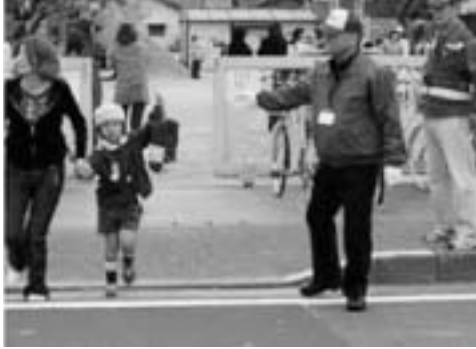
登下校安全巡視員による活動

町民一体となって、幼児、児童生徒の安全確保のための取組を行っています。今年度からは学校支援を中心に全町的安全確保のために地域安全指導員による見守りをはじめます。