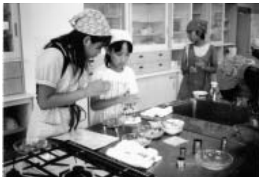
児童館「たのしいおやつづくり」