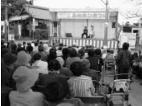
未来タウン北方ふれあいまつり

また、観光協会の運営に対する補助や、町内で開催されるお祭りなどのイベント（お十七夜、かいこまつり）への支援をします。