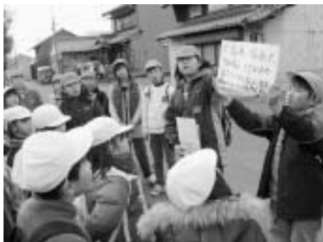
能力開花推進事業による総合的な学習時間(北方小学校)

幼稚園、小学校、中学校では、基礎学力、コミュニケーション能力の向上を図るとともに地域の実態などをふまえた特色ある教育を行うため、幼稚園、小・中学校に必要経費（定額）を交付します。