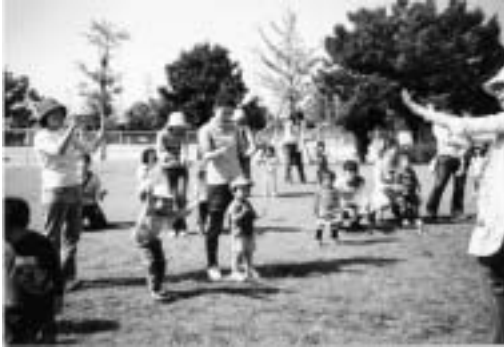
子育て支援センターの「メルヘン」

お子さんの多い家庭の経済的負担を軽減するために保育園、幼稚園、小・中学校に通う第3子以降の児童・生徒の保護者負担額のうち学習費や給食費を助成しています。