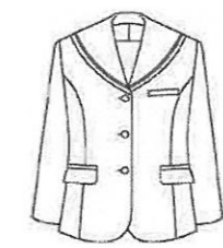
セーラージャケット