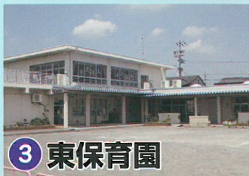
3 東保育園 ☎323-0577