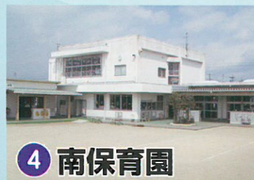
4 南保育園 ☎324-0611