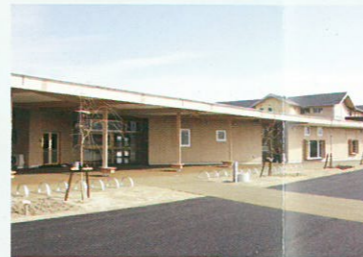
8 北方みなみ子ども館 ☎322-2350