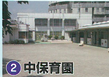
2 中保育園 ☎324-8313