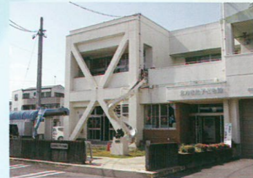
7 北方きた子ども館 ☎323-0254