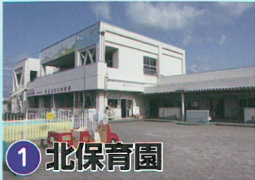
1 北保育園 ☎324-0254