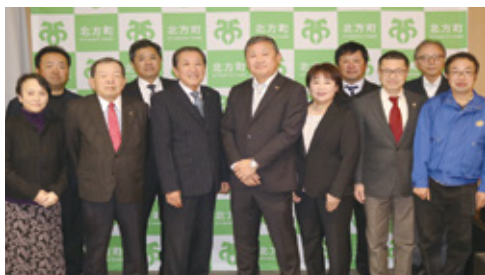
▲ 町長と本巣ライオンズクラブの皆さん

本巣ライオンズクラブ北方メンバーの皆さんが、令和5年中の町におけるボランティア活動の報告と、令和6年の活動予定やライオンズクラブへの要望のために町長を表敬訪問されました。町長は1年間のボランティア活動に感謝するとともに、町障がい福祉サービス事業所もちの木の研修サポートの継続や公園清掃等を要望しました。