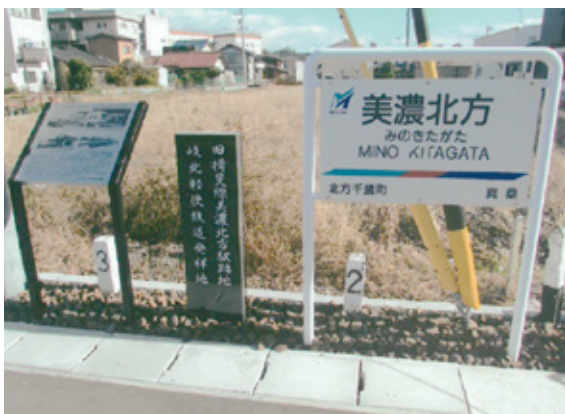
▲ (左から) 説明板・記念碑・駅名板

町文化財保護協会は、町に鉄道があった歴史を後世に伝えたいと考え、美濃北方駅跡地に記念碑、説明板、駅名板の設置整備を進めてきました。皆さんの温かい寄付のおかげで完成することができました。ぜひお立ち寄りください。