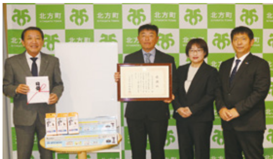
▲ 町長と(株)愛岐通信中森社長ご夫妻(中央)、大垣西濃信用金庫北方支店長(右)