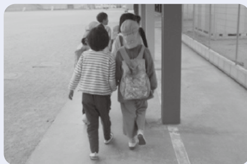
▲1年生が園児を案内する様子