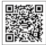
▲ひとり親以外世帯分

(*)平成17年4月2日(障害の状態にあり、特別児童扶養手当の支給対象となっている場合は平成15年4月2日)から令和6年2月29日までに生まれた児童。