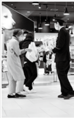
モレラ岐阜における広報啓発活動の様子

モレラ岐阜における広報啓発活動の様子 70歳以上の高齢者及びその同居の家族の名義の電話について、有料のサービスであるナンバーディスプレイ及びナンバーリクエストという非通知設定された番号からの電話を拒否するサービスを無料化する取り組みを行っています。 ニセ電話詐欺被害のほとんどが、固定電話への1本の電話から始まっています。固定電話対策について北方警察署生活安全課までご相談ください。