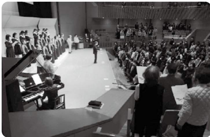
前回の合唱集会の様子