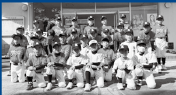
▲軟式野球総合開会式 集合写真

集しています。少しでも多くの子も達にも野球の楽しさ、集団スポーツの喜びを味わってもらえるよう、親さんの当番負担や行事などの削減を行っています。ご不明な点はお気軽にお問合せください。