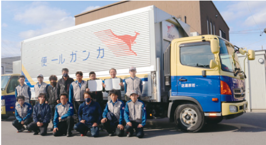
▲ 町長と若原運送有限会社の皆さん

協定の締結に当たり若原社長から「町内で活動していく中で、できる限りの協力はしていきたい。」と力強い言葉をいただきました。